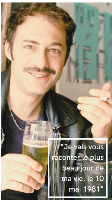
"Je vais vous raconter le plus beau jour de ma vie, le 10 mai 1981"