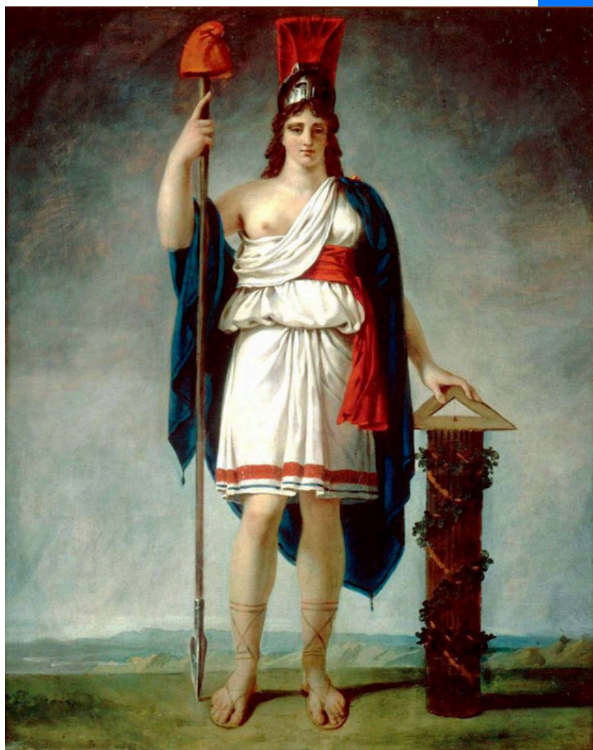
Jean-Antoine Gros, Figure allégorique de la République